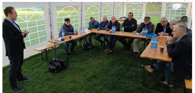
Walne Zebranie Sprawozdawcze.

Ponadto 21 kwietnia na stadionie miejskim w Czaplinku odbyło się Walne Zebranie Sprawozdawcze naszego klubu. Podczas tego