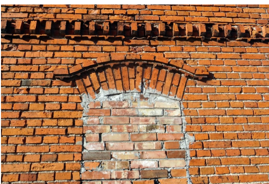
2. Fragment ściany budynku z pracownią rzeźbiarską E. Szatkowskiego przy ul. Leśników.

Spacerowicze idący ul. Leśników zatrzymują się nieraz przy pracowni czaplineckiego rzeźbiarza Edwarda Szatkowskiego. Pracownia urządzona jest w części XIX-wiecznej stodoły z czerwonej cegły. Istnieje pogląd, że w budynku tym mieściła się w przeszłości wozownia ze stajnią. Budynek ma dwie bramy. Mniejsza brama prowadzi do pracowni rzeźbiarskiej, większa - do dużego pomieszczenia wykorzystywanego przez OSP do przechowywania sprzętu. Na fasadzie tego obiektu zwraca uwagę zamurowane okno (fot. nr 2). Rodzaj cegieł użytych do zamurowania wskazuje, że okno zlikwidowano dopiero po II wojnie światowej. Widoczne na fasadzie tego budynku ozdobne detale architektoniczne (częściowo zniszczone podczas przebudowy bram) są