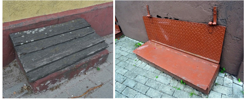
3. Przykłady zasłoniętych okien piwnicznych w centrum miasta.

identyczne z tymi, które zdobyły już nieistniejącą, a stojącą w przeszłości przy ul. Szczecinek (znana już tylko ze zdjęć) dużą stodołę oznakowaną datą 1864. Detale takie zdobiją również stojącą do dziś przy ul. Złocienieckiej stodołę opisaną w 8. części artykułu. Pracownia rzeźbiarska zajmuje obecnie niewielką część budynku. Jest pomysł, by powiększyć powierzchnię pracowni. W przypadku jej powiększenia trzeba byłoby pracownię doświetlić odtwarzając zamurowane okno. Warto zauważyć, że zamurowany otwór okienny ma takie samo ozdobne wykończenie jak wnęki imitujące okna (tzw. blendy) na fasadach wspomnianych wyżej stodoł przy ul. Złocienieckiej i Szczecinek.