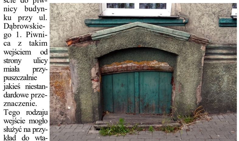
4. Nieczynne wejście do piwnicy budynku przy ul. Dąbrowskiego 1.

Charakterystycznym elementem starej zabudowy Czaplinka są piwniczne okienka znajdujące się na poziomie gruntu (przeważnie na poziomie chodnika). W przeszłości okienka te spełniały ważną rolę. Nie tylko umożliwiały dostęp światła do piwnic, lecz służyły także do wrzucania do piwnicznych pomieszczeń opału lub ziemniaków. Funkcję tę pełnią one już teraz bardzo rzadko. Z tego powodu większość piwnicznych otworów okiennych jest obecnie zasłonięta w sposób trwały lub prowizorycznie. Idąc chodnikiem wciąż trzeba pamiętać o omijaniu przeszkód w postaci niskich murków, pokryw i klap zabezpieczających piwniczne okienka. Dwa przykłady z centrum miasta widzimy na ilustracji nr 3. Na fot. nr 4 widzimy z kolei nieczynne wejście do piwnicy budynku przy